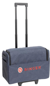
Bolso con ruedas Singer