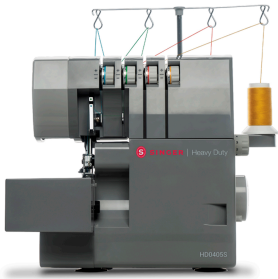
Máquina Overlock Singer HD405S Heavy Duty