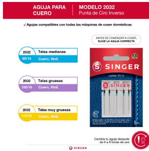
Aguja 2032 para cuero