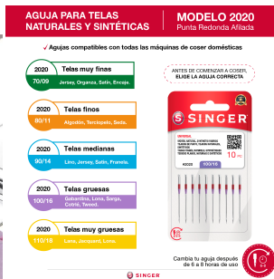
Aguja 2020 para telas naturales y sintéticas