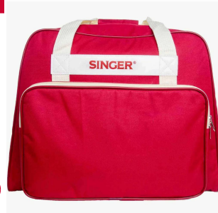
Bolso Singer Color Ladrillo